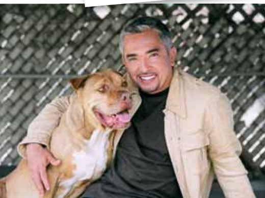
Cesar met 'rechterhand' Daddy, die we allemaal missen.

om hem in Amsterdam te ontmoeten. Met wat hulp van haar Engelse cockerspaniël Snuit welteverstaan. Hij wordt ingezet als eigenwijze, schooiende en aan de lijn trekkende kandidaat voor de auditie van de Cesar Millan Live Show .